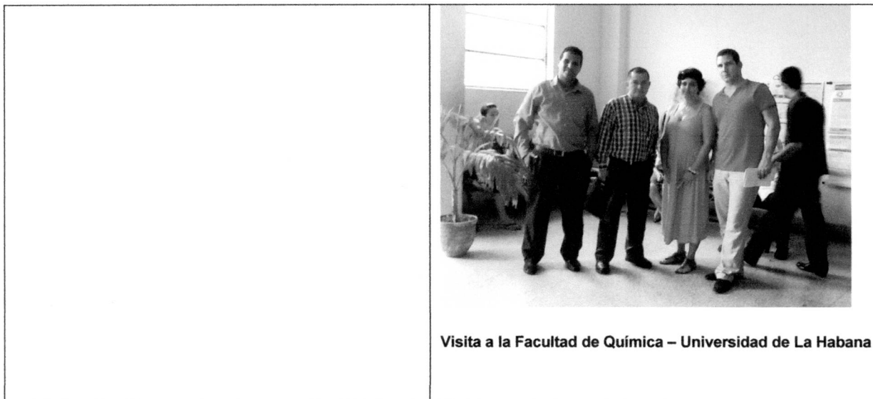
Visita a la Facultad de Química – Universidad de La Habana