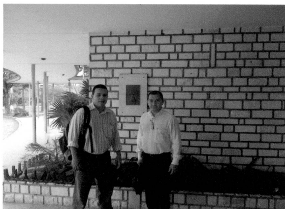
Visita a la Universidad de Las Villas