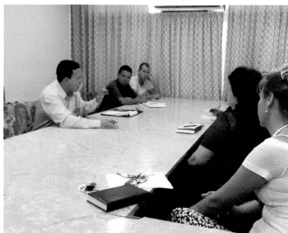
Reunión en la Universidad de Las Tunas