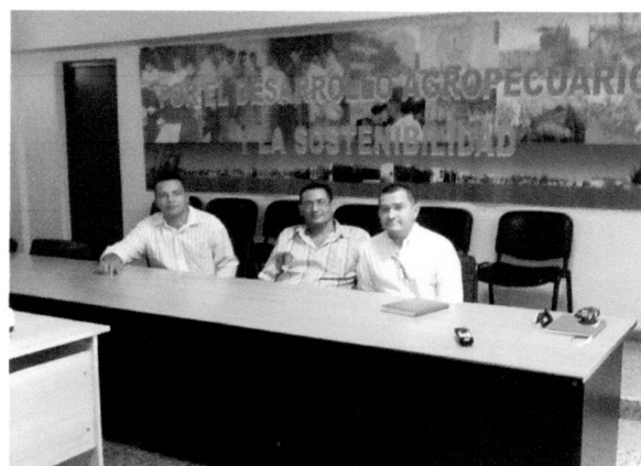
Reunión en la Facultad de Ciencias Agropecuarias – Universidad de Las Villas