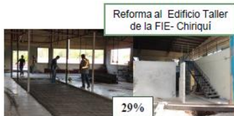
Reforma al Edificio Taller de la FIE- Chiriquí