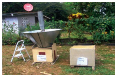
Figura 1. Estructuras Finales: Recinto Cerrado de Control versus Recinto con Sistema de Ventilación.

Se tomaron como muestra la medición de las temperaturas en los dos recintos tomando en cuenta que uno posee el sistema de ventilación y el otro está totalmente cerrado. Por otra parte, se obtuvieron las temperaturas en el tubo del sistema y el ambiente. Se recopilaron estas mediciones por espacio de 30 días en las horas donde el sol es más fuerte a fin de evaluar si el sistema de ventilación cumple con el funcionamiento que se tenía planeado. Se debe tomar en cuenta que estas muestras fueron tomadas a la misma hora durante los treinta (30) días de experimentación.